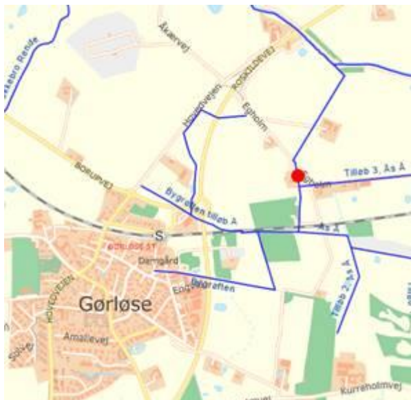
Fig. 2: Rød prik på blå streger er tænkt eksempel hvis der sker brud på den ikke renoverede del af Ås Å. Blå streger er vandløb.

I begge tilfælde vil Hillerød Kommunen sandsynligvis være erstatningsansvarlig for eventuelle skader på ejendomme/afgrøder, da ledningernes dårlige tilstand er kendt.